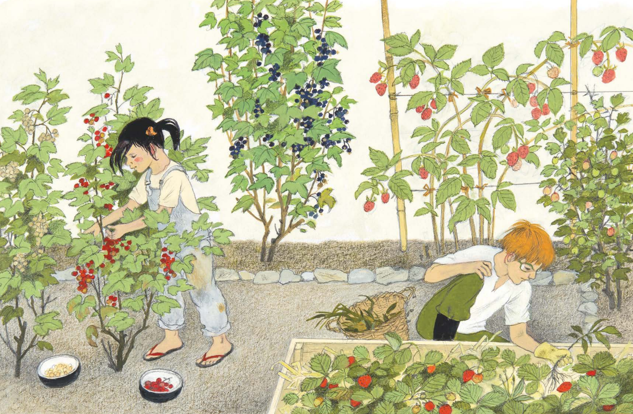
groselles vermelles i blanques