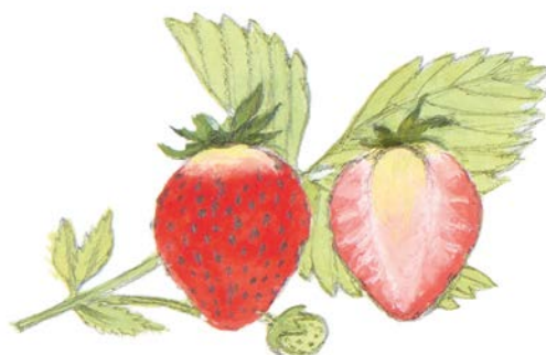
una maduixa i mitja maduixa