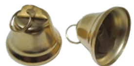
Picarols o campanetes